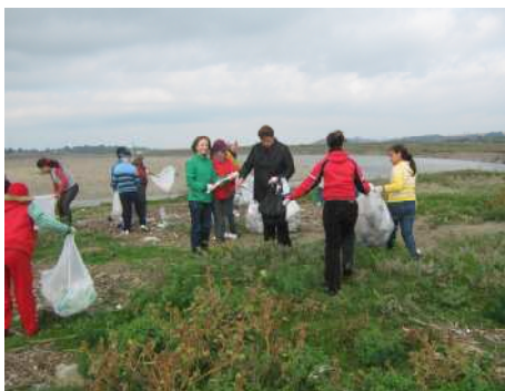
Elevi și cadre didactice care au participat la proiect