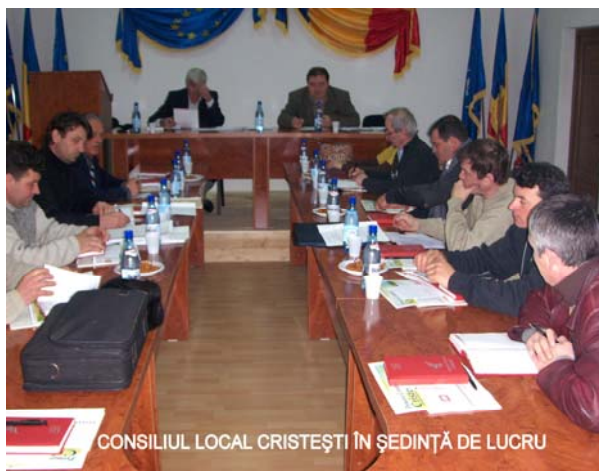
CONSILIUL LOCAL CRISTEȘTI ÎN ȘEDINȚĂ DE LUCRU

Hotărârea nr. 92 aprobă dreptul de trecere și utilizare a drumului sătesc care face legătura între DN2 și malul stâng al râului Moldova pentru autovehiculele și utilajele TB AGREGATE CONSTRUCT SRL Cris-tești , cu condiția întreținerii permanente