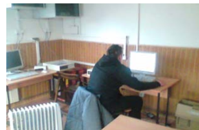
Sala de Internet a RECL Cristești