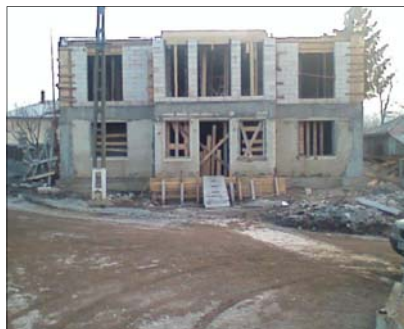
Clădirea Primăriei în construcție