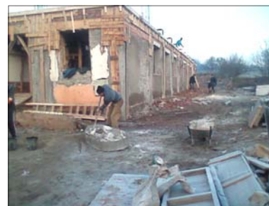
Sala Polivalentă în construcție