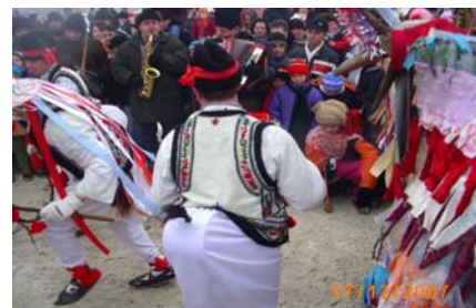
Căiuții din Herești