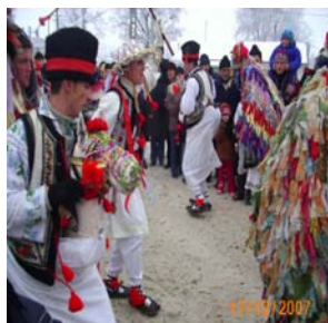
Căiuții din satul Herești